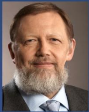
Дубинин С. К. Председатель Наблюдательного совета ОАО Банк ВТБ