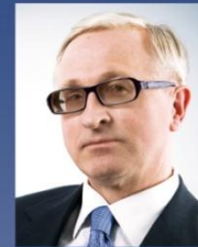
Шохин А. Н. Президент РСП