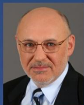
Столин В. ОАО "МХК "ЕвроХим"