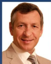
Плешаков А. ОАО "Международный аэропорт Шереметьево"