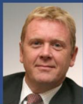
Роудс М. Д. ОАО "ФосАгро", ОАО "Росинтер Ресторантс", ОАО "Группа Черкизово"