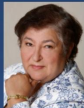
Златкис Б. Национальный расчетный депозитарий