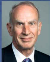
Маргеттс Р. Д. (Сэр) АК "АЛРОСА" (ОАО)