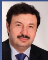
Мау В. ОАО "ТРАНСКАПИТАЛБАНК", ОАО "Талприм", ОАО "Сбербанк России"