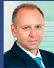
Пумпянский А. А. Председатель совета директоров ОАО Трудовая металлургическая компания (ТМК)