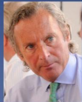
Энг М. Д. ОАО "Северсталь"