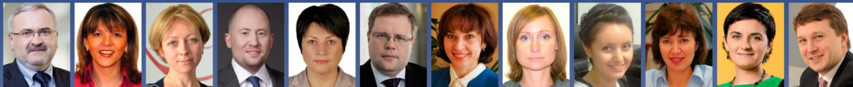
Малинин С. Банк "Возрождение" (ОАО)