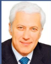
Ландиа А. ОАО "СУЭК", ОАО "МХК ЕвроХим"